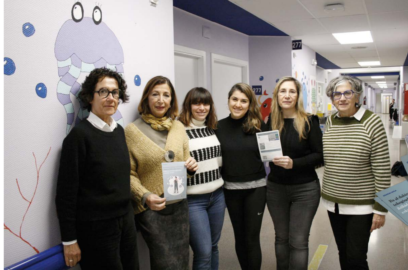
Proiektuan parte hartzen duten langileak, aurkezpenaren egunean.

Euskaraz aritzeko zenbait neurri hartu dituzte, arta hori bermatzeko. Bestek beste langile elebidunen identifikazioa —e hizkuntza lehenetsiaren zeinuaren bitartez—, erabiltzaileen hizkuntza aukera ikusaraztea, emagin eta ginekologo euskaldunekin hitzorduak ematea, agiriak euskaraz idaztea eta erditze-ikastaroak ere hizkuntza horretan eskaintzea.