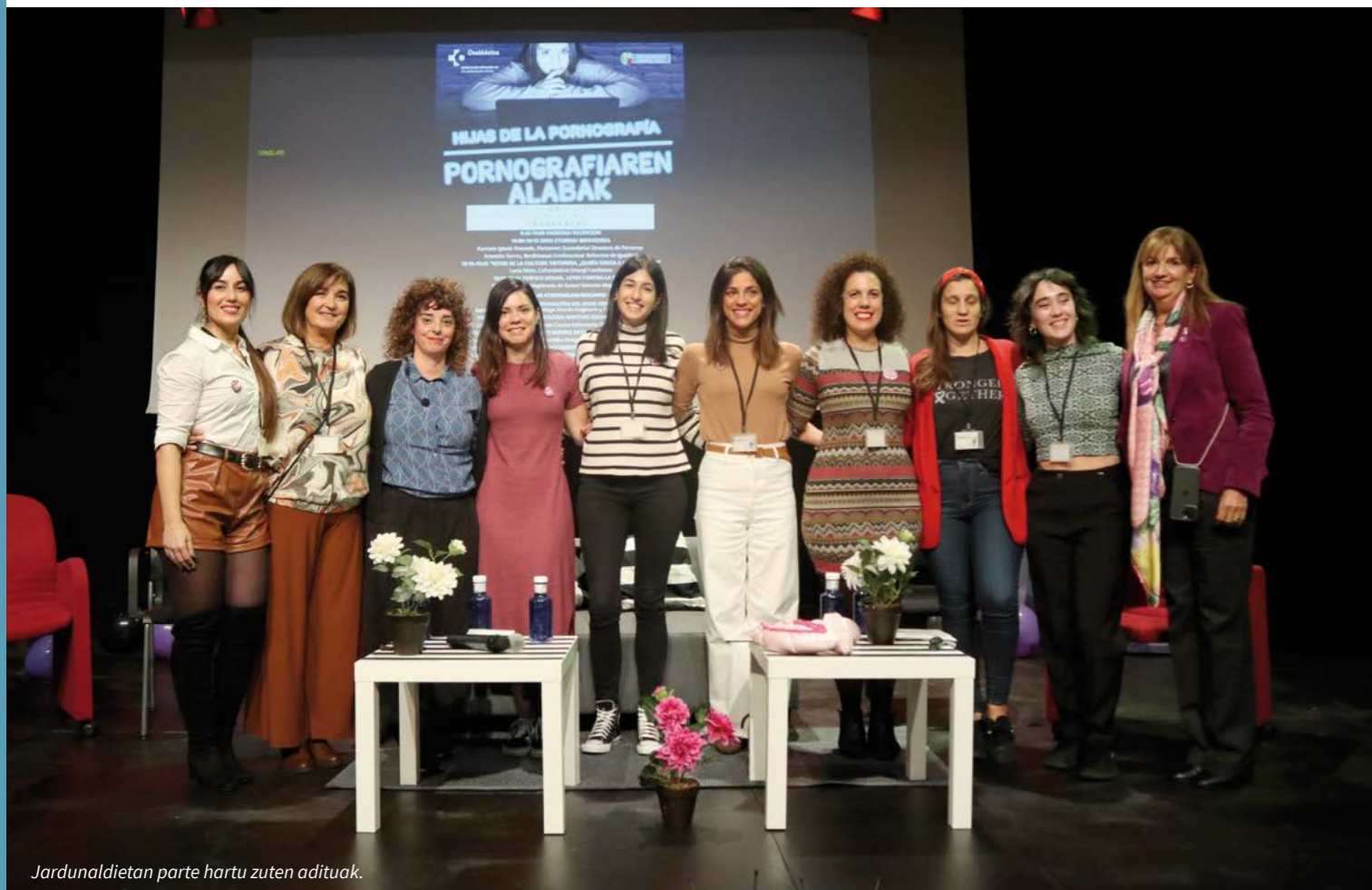
Jardunaldietan parte hartu zuten adituak.