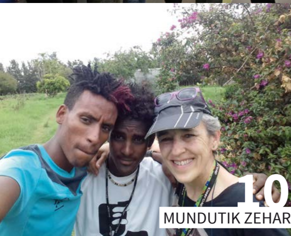
MUNDUTIK ZE HAR