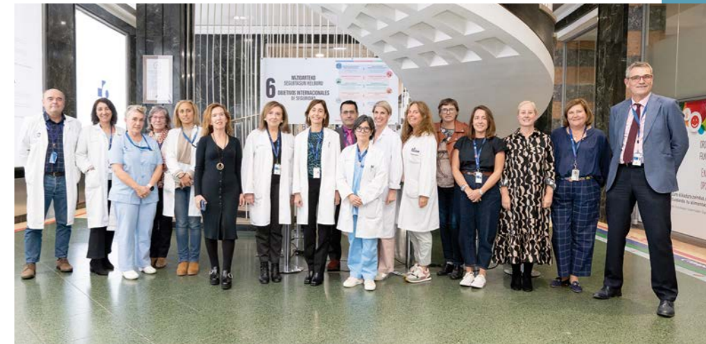
Ezkerralde-Enkarterri-Gurutzetako ESiko zuzendaritza-taldea.

Hobekuntza ugari egin dira erradio-diagnostikoaren kudeaketan, LEQ kudeaketan eta integrazio-tresnetan, bai asistentzia-ibilbideetan, bai ibilbide instrumentaletan. Lehen Mailako Arretan, berri, aurrera egin da fisioterapiaren hedapenean. Halaber, hornidura-katerako, besteak beste, kontingentzia-plan