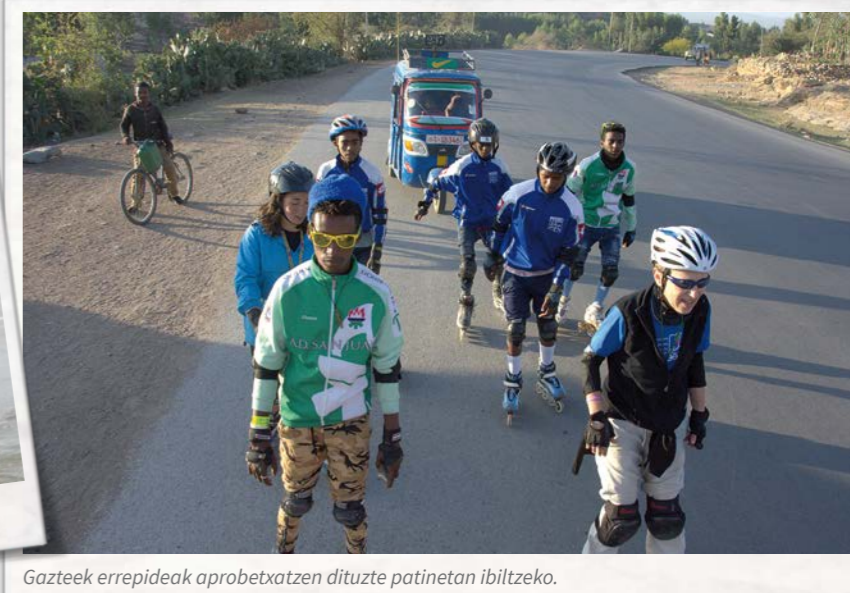
Gasiteek errepideak aprobetxatzen dituzte patinetan ibiltzeko.