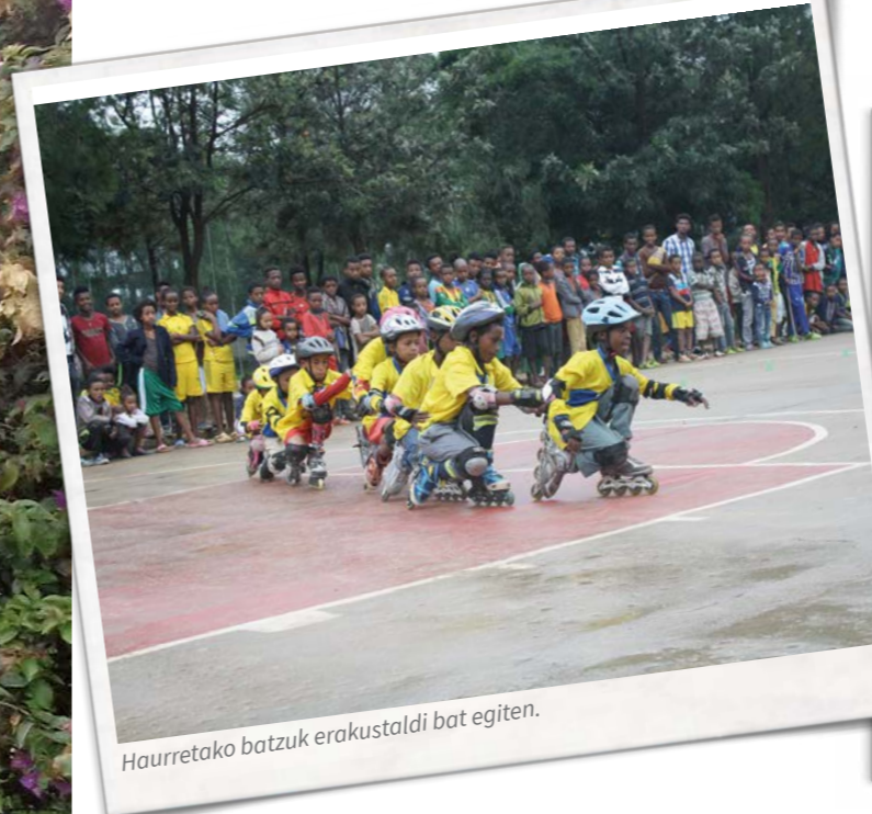
Haurretako batzuk erakustaldi bat egiten.

Arrakasta itzela izan zuen. Haiei patinatzen irakastea esperientzia zoragarria bilaka-